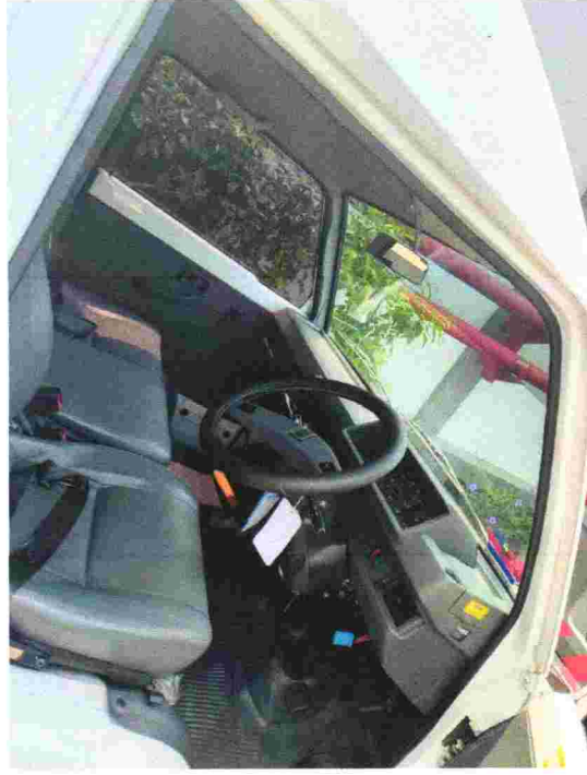
1.5. Mitsubishi I300 (Ambulance – Skrap)